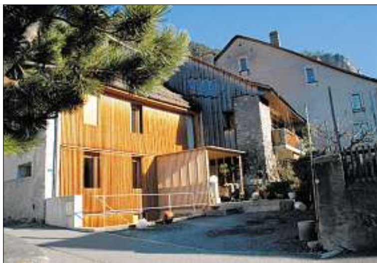
Gelungene Umnutzung eines Stalls: Ein Beispiel, das die Jury zur Vergabe des Wakkerpreises an Fläsch bewegt hat. (nw)

In ihrem Leitbild hat sich die Gemeinde Fläsch das Ziel gesetzt, das «Schmuckstück der Bündner Herrschaft» zu sein. Mit der Verleihung des mit 20 000 Franken dotierten Wakkerpreises verhilft der Schweizer Heimatschutz diesem Schmuckstück zu besonderem Glanz. Geschäftsleiter Adrian Schmid bezeichnete Fläsch gestern an der Medienkonferenz im Gemeindehaus als eigentlichen «Glücksfall». Dank einer innovativen Ortsplanung hätten einerseits